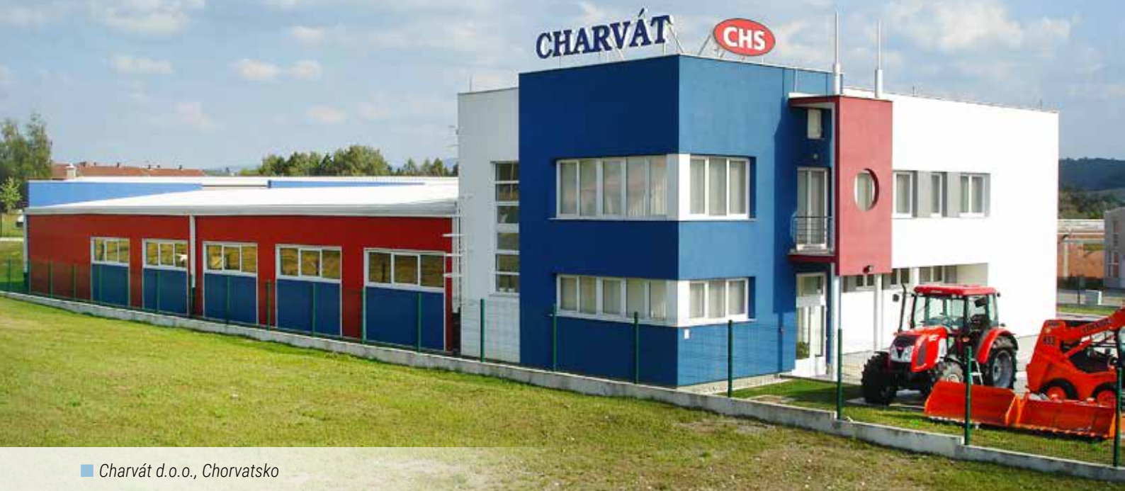
■ Charvát d.o.o., Chorvatsko