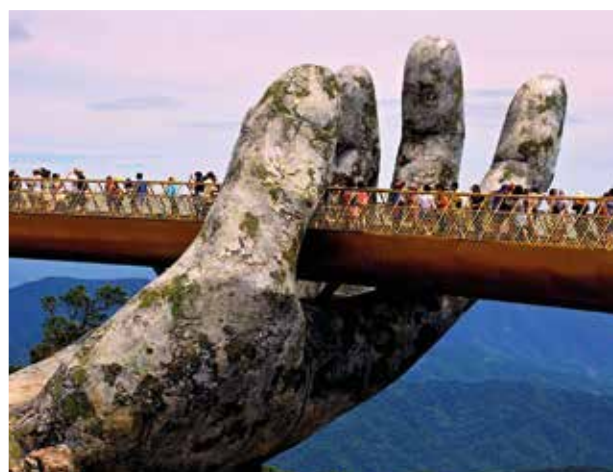
■ Čestné uznání - Cena za fotosérii Vojtěch Moša: Z cest po Severním Vietnamu