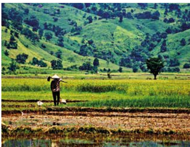
■ Čestné uznání - Cena za fotosérii Vojtěch Moša: Z cest po Severním Vietnamu