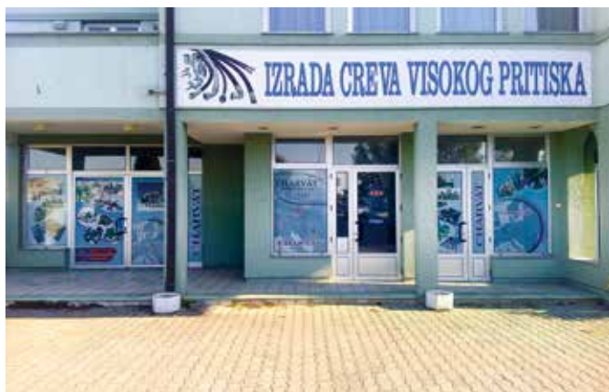
■ Charvát d.o.o., pobočka Srbsko