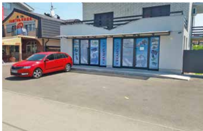
■ Charvát d.o.o., pobočka Bosna