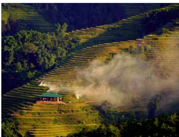
■ Čestné uznání - Cena za fotosérii Vojtěch Moša: Z cest po Severním Vietnamu