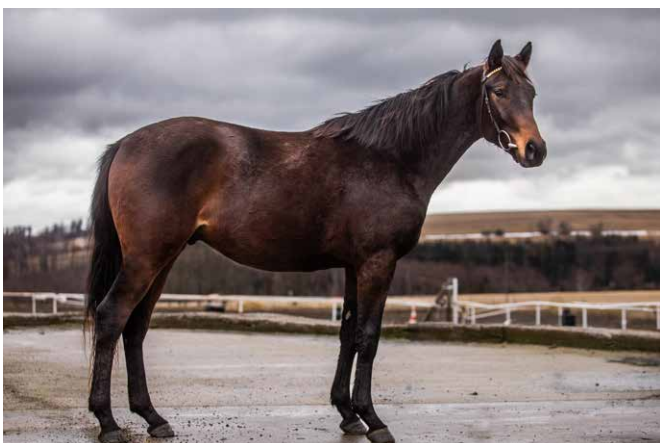
DUMNONIA STAR (odchov)