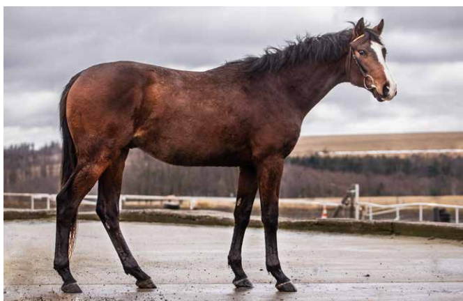
N.N. (GB) ex Catadupa