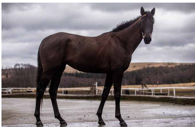
N.N. (IRE) ex Lady Canford