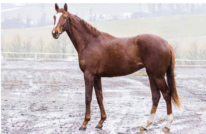
HIDDEN GIRL (FR) - vítěz ročníku 2023