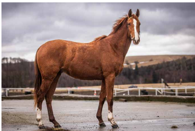
N.N. (GER) ex Win for life